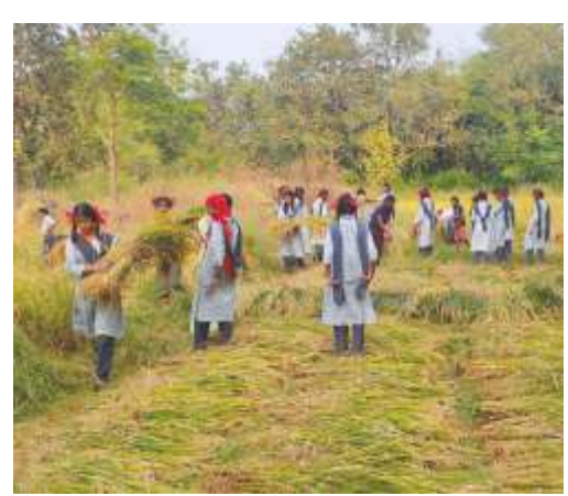
Rice cultivation at Pangrad School