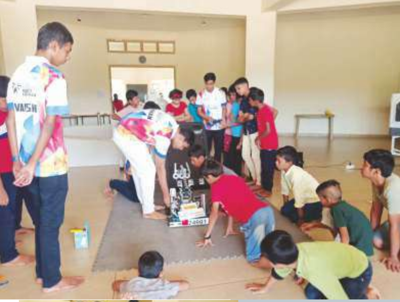
Robotics at Vidyaniketan Convent School, Kasal