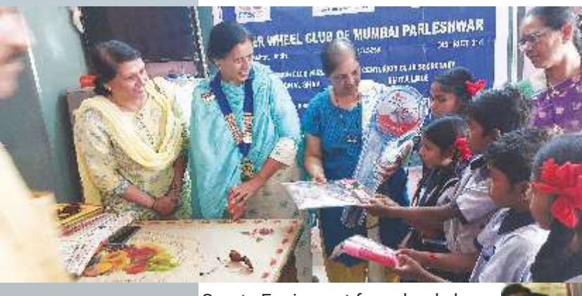
Nutritious Diet for School Girls under healthy women, healthy child programe