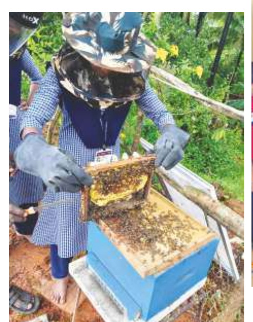
Honey Bee rearing