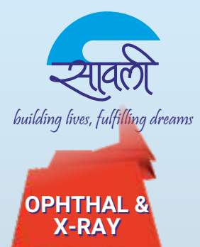
Inaguration of X-Ray Department