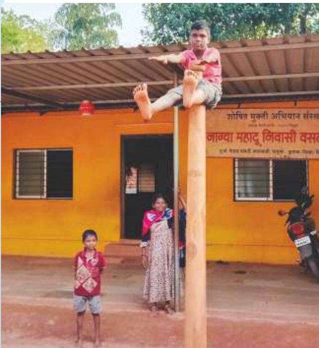
Mallakhamb at Kudal